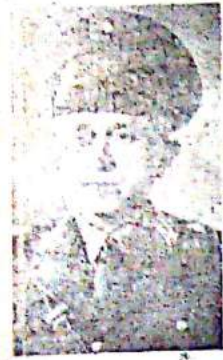
General Eurico Gaspar Dutra